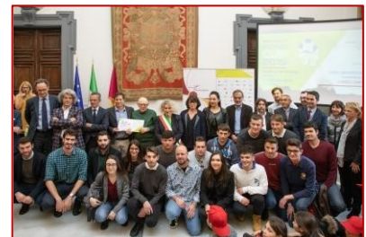
Premiazione in Campidoglio